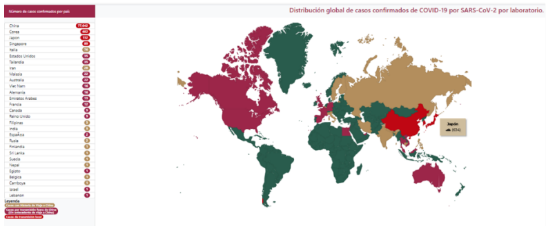
Distribución global de casos confirmados de COVID-19 por SARS-CoV-2 por laboratorio al día 23 de Febrero del 2020.