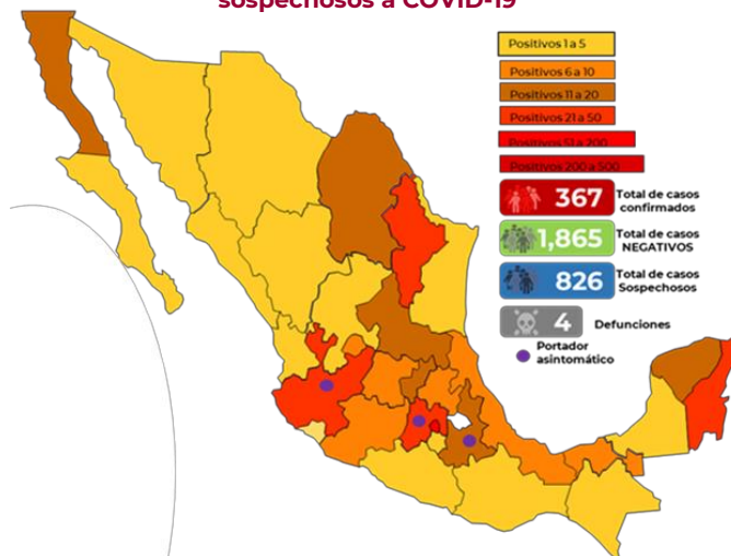
Mapa de México con los casos confirmados, negativos y sospechosos a COVID-19