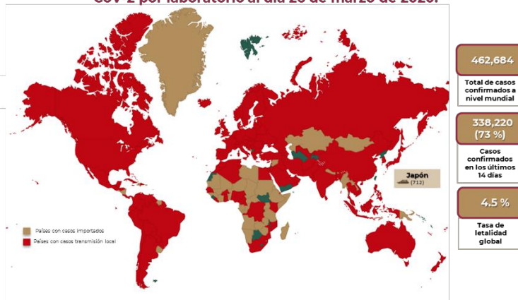
Distribución global de casos confirmados de COVID-19 por SARS-CoV-2 por laboratorio al día 26 de marzo de 2020.