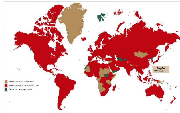
Distribución global de casos confirmados de COVID-19 por SARS-CoV-2 por laboratorio al día 01 de abril de 2020.

823,626 Total de casos confirmados a nivel mundial 630,332 (77%) Casos confirmados en los últimos 14 días 4,9% Tasa de letalidad global