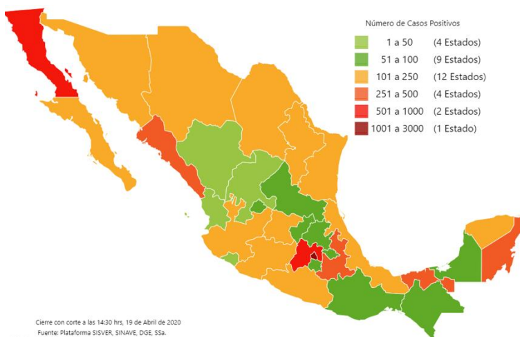
Mapa de México con los casos confirmados, negativos y sospechosos a COVID-19