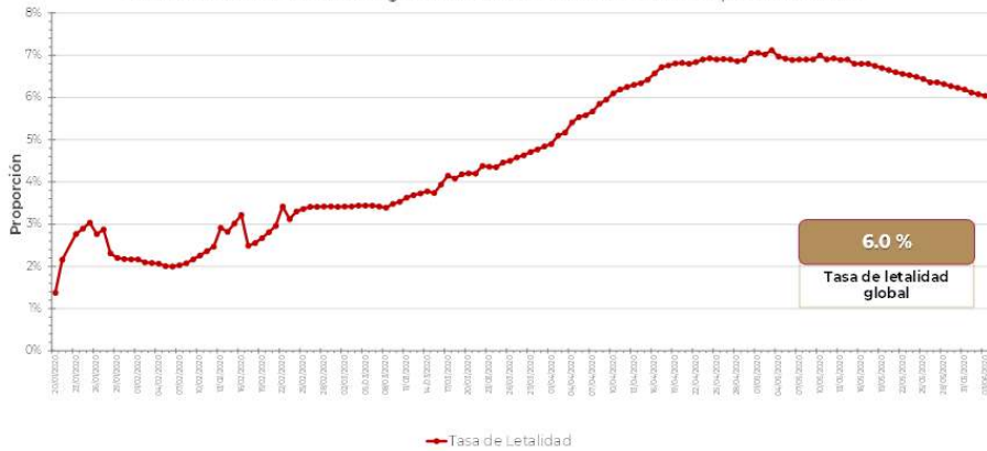
Gráfico 2. Tasa de letalidad* global de casos nuevos de COVID-19 por SARS-CoV-2

Hasta la fecha, se han reportado casos en 215 países, territorios y áreas ; los casos se han notificado en las seis regiones de la OMS (América, Europa, Asia Sudoriental, Mediterráneo Oriental, Pacífico Occidental y África).