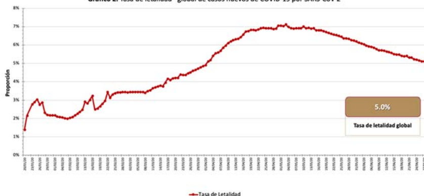
Gráfico 2. Tasa de letalidad global de casos nuevos de COVID-19 por SARS-CoV-2

Hasta la fecha, se han reportado casos en 215 países, territorios y áreas ; los casos se han notificado en las seis regiones de la OMS (América, Europa, Asia Sudoriental, Mediterráneo Oriental, Pacífico Occidental y África).