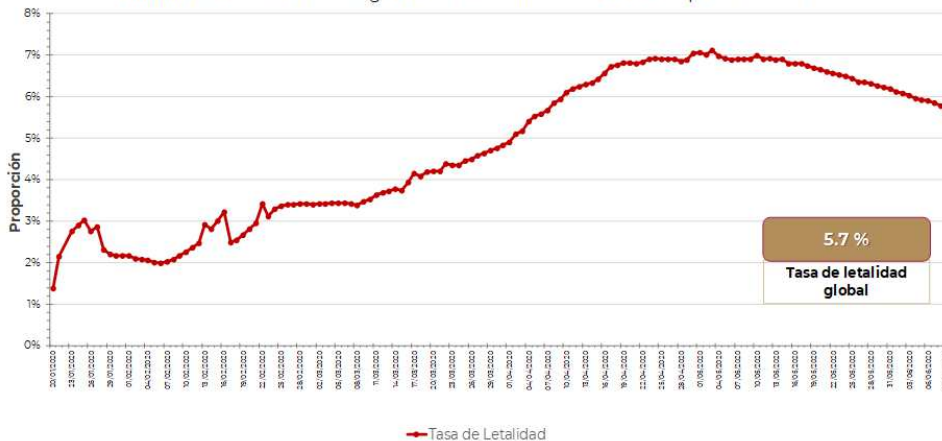
Gráfico 2. Tasa de letalidad* global de casos nuevos de COVID-19 por SARS-CoV-2

Hasta la fecha, se han reportado casos en 215 países, territorios y áreas ; los casos se han notificado en las seis regiones de la OMS (América, Europa, Asia Sudoriental, Mediterráneo Oriental, Pacífico Occidental y África).